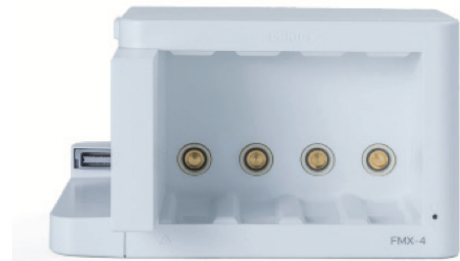
Modul-Rack mit 4 Steckplätzen FMX-4 mit Halterung für Kombi-Modul

Das X3 kann über ein FMX-4 Modul-Rack an den Monitor angeschlossen werden.